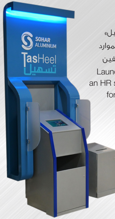
تدشين «تسهيل» للخدمة الذاتية للموارد البشرية للموظفين Launch of TasHeel , an HR self-service kiosk for employees