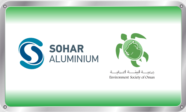
عضوية جمعية البيئة العمانية ESO Corporate Membership