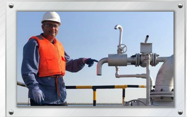
خط أنابيب القار السائل Liquid Pitch Pipeline