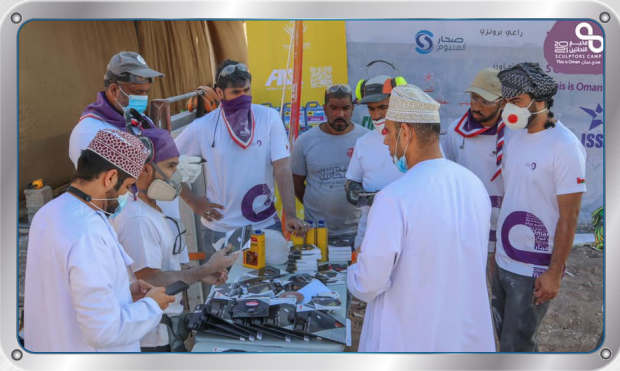
رعاية مخيم النحاتين Sculptor's camp sponsorship