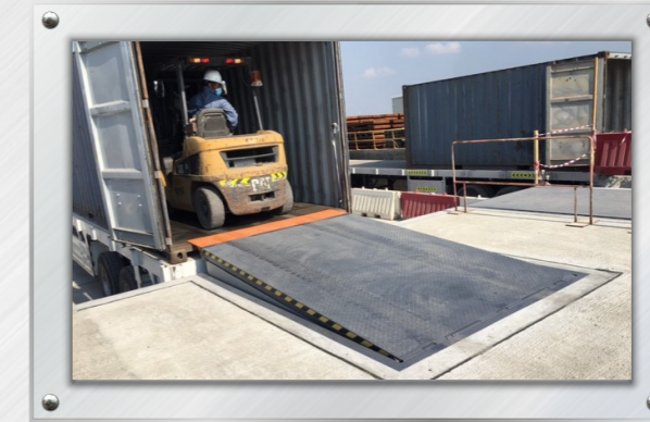
منصة التفريغ في المستودع ٢ Offloading Ramp in Warehouse 2