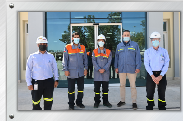
مرافق التدريب الجديدة The new state-of-the-art training facility