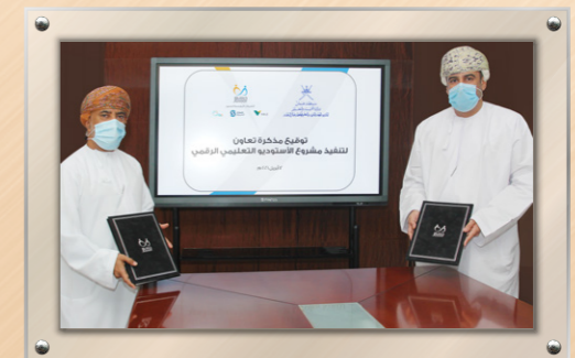
بتمويل من صحار ألومنيوم وفالي عمان وأوكيو جسور توقع اتفاقية لتنفيذ مشروع الاستوديو التعليمي الرقمي Funded by Sohar Aluminium, Vale Oman, and OQ Jusoor Signs an Agreement to Establish a Digital Education Studio