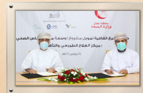
بتمويل من أوكيو وصحار ألومنيوم وفالي عمان جسور توقع اتفاقية تمويل مشروع إنشاء مركز العلاج الطبيعي والتأهيل Funded by OQ, Sohar Aluminium, and Vale, Jusoor Inks Pact to Establish a Physiotherapy & Rehabilitation Center