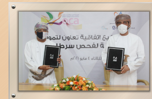
بتمويل من صحار ألومنيوم وفالي عمان وأوكيو جسور توقع اتفاقية تمويل مشروع الوحدة المتنقلة لفحص سرطان الثدي بالتعاون مع الجمعية العمانية للسرطان Funded by Sohar Aluminium, Vale Oman, and OQ, Jusoor Signs an Agreement with Oman Cancer Association to Establish a Mobile Mammography Unit