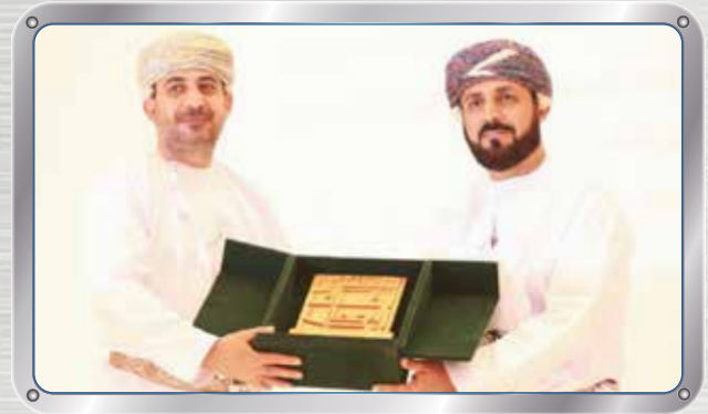
صحار ألمنيوم ترعى ندوة آفاق الإعمار SA Sponsors OCCI Construction Forum