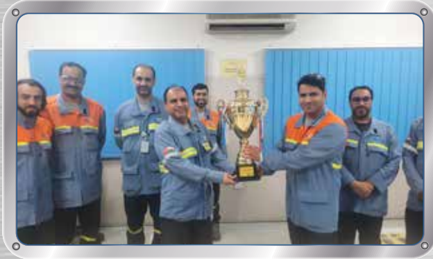
حصل معمل الكربون على جائزة "أفضل منطقة عمل من حيث مستوى رطوبة الجسم" لشهري إبريل ومايو ٢٠٢٢ The Carbon Plant was conferred the "Best Hydrated Work Area" for the months of April and May 2022.