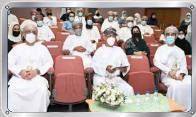
صحار ألمنيوم ترعى تطبيق التبرع بالأعضاء SA Sponsors a Body Organs Donation App