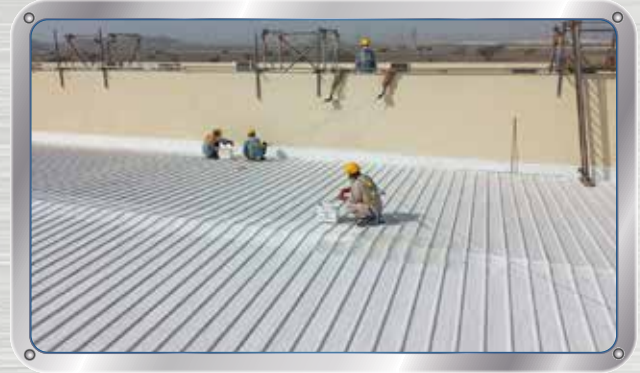
ترميم سقف ورشة معهد صحار للتدريب الصناعي Sohar Industrial Training Institute (SITI) Workshop Roof Refurbished