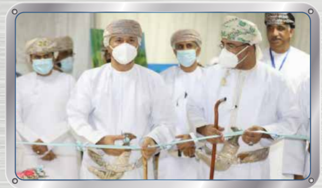
صحار ألمنيوم ترعى معرض المياه SA Sponsors Water Exhibition