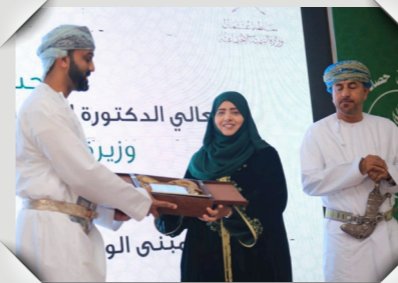
افتتاح مبنى فريق حصاد لوى الخيري Hassad Liwa Charity Team Building Inaugurated