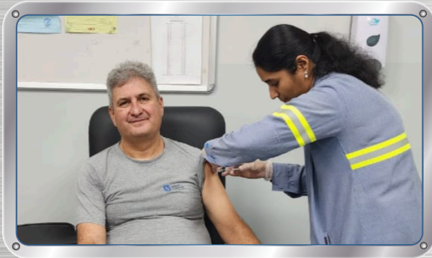
حملة التطعيم ضد الإنفلونزا Flu Vaccination Campaign