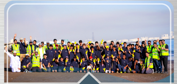
حملة تنظيف شاطئ مجيس Beach Cleanup in Majees