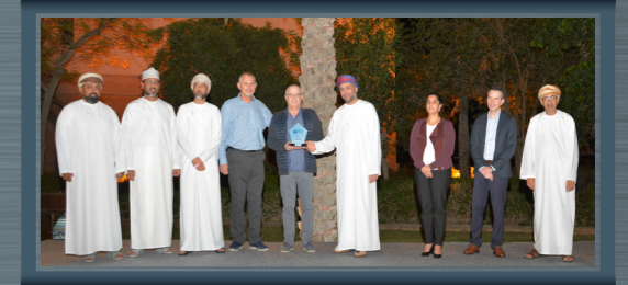
أكتوبر ٢٠٢٢ المصهر المشروع إعادة تدوير الأنود October 2022 Reduction Project Anode Recycling