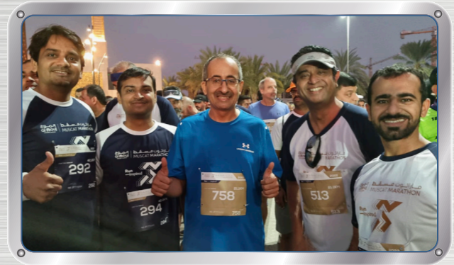
الرئيس التنفيذي وموظفين يشاركون في ماراثون الموج مسقط ٢٠٢٢ CEO and Employees run Al Mouj Muscat Marathon 2022