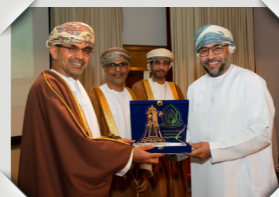
المؤتمر الأول حول حماية النبات The first International Conference on Plant Protection