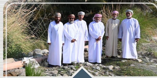
صحار أمنيوم تدعم صيانة الأفلاج المحلية SA supports maintenance of local Falajes