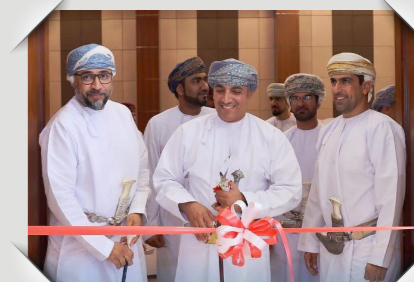
الموسم الثقافي ٢٠٢٢ بشمال الباطنة North Al Batinah's Cultural Season 2022