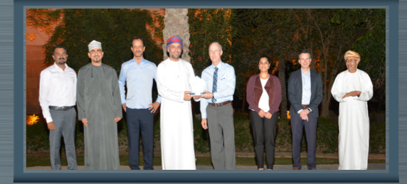
سبتمبر ٢٠٢٢ الصيانة المركزية والهندسة المشروع دراسة الأنود ١٦٣٠مم September 2022 Central Maintenance and Engineering Project 1630mm Green Anode Study