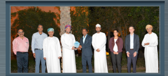
نوفمبر ٢٠٢٢ معمل الكربون، والعقود والمشتريات المشروع تحويل مخلفات تغطية التجايف إلى باث November 2022 Carbon Plant and SCM Project Converting Cavity Cleaning Waste into Tapped Bath