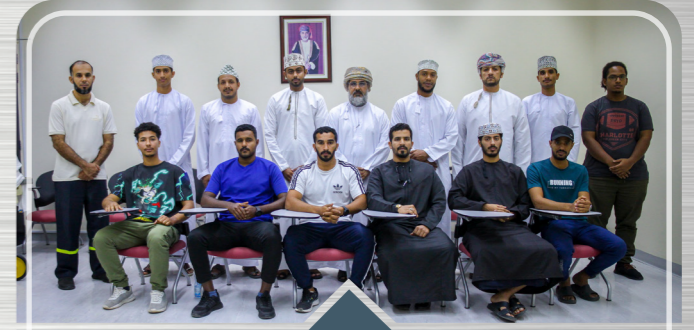
برنامج تدريبي في الإنعاش القلبي الرئوي CPR Training