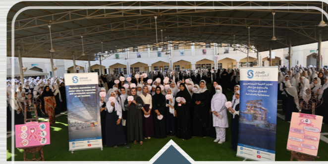
حملة توعوية في المدارس حول سرطان الثدي Breast Cancer Awareness Campaign in Schools