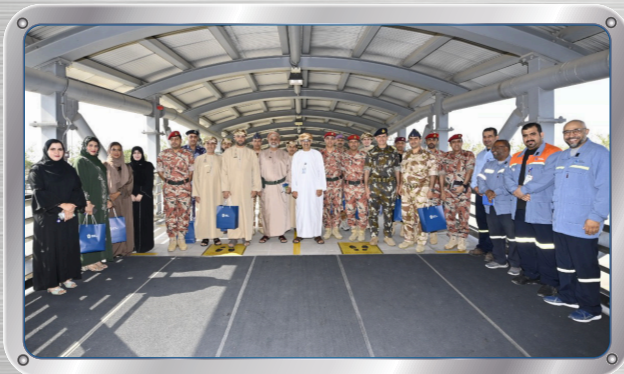
المشاركون في دورة الدفاع الوطني يزورون صحر أمنيوم National Defense Batch Visit SA