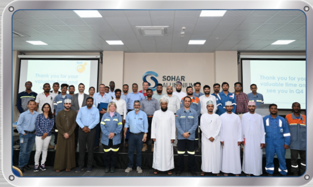
اجتماع البيئة والصحة والسلامة الربع سنوي للمتعاقدين Contractors Quarterly EHS Meeting Held