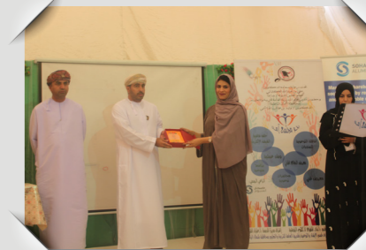
ملتقى نحو مجتمع آمن "Towards a Safe Community" Gathering