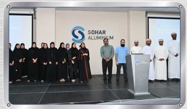
طالبة جامعة التقنية يزورون صحر أمنيوم Students from University of Technology Visit SA