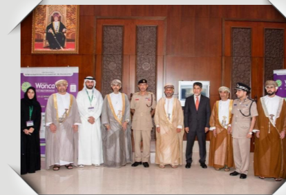
مؤتمر صحة الأسرة Family Physicians Conference