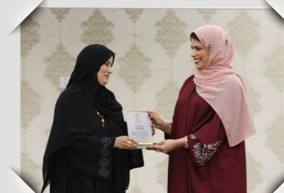
ملتقى المرأة العمانية "مُلهمة" Omani Women Forum "Mulhimah"