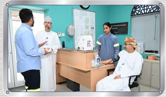
الفريق الطبي يحتفل بيوم القلب العالمي Medical Team Marks World Heart Day