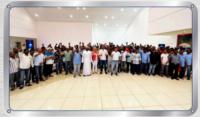
فعالية ترفيهية للمتعاقدين Entertainment Event for our Contractors