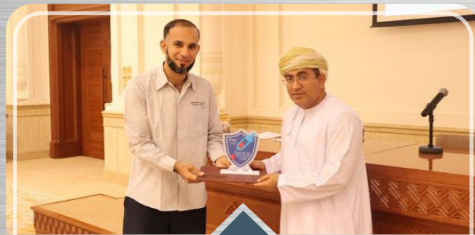
صحار أمنيوم ترعى ورشة عمل في مجال الوقاية ومكافحة العدوى. SA Sponsors Infection Prevention and Management Workshop