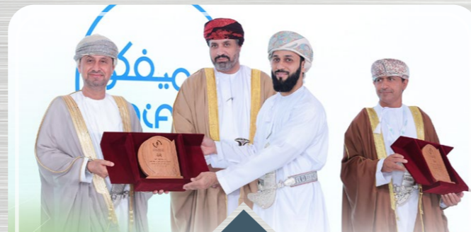
صحار أمنيوم ترعى المؤتمر الرابع للاتحاد العام لعمال سلطنة عُمان SA Sponsors the 4 th Conference of General Federation of Oman Workers