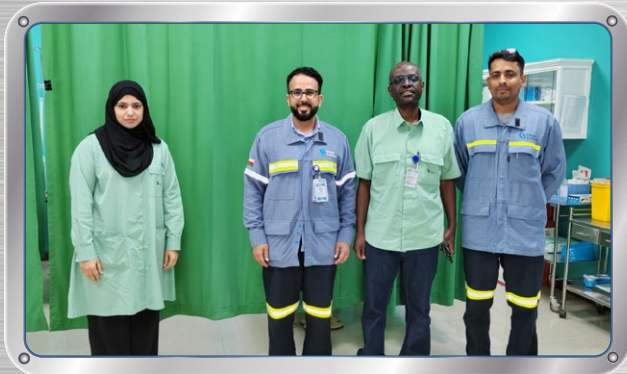
الفريق الطبي في فالي عمان يزور صحر أمنيوم Vale Oman's Medical Team Visits SA