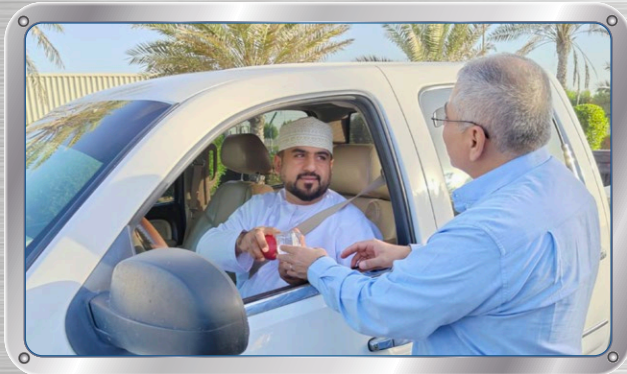
إطلاق حملة إدارة الإجهاد الحراري Heat Stress Management Campaign Launch