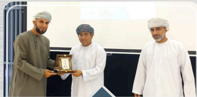
صحار أمنيوم ترعى حلقة عمل "تبسيط الإجراءات الإدارية" التي نظمتها مستشفى صحار Sohar Aluminium sponsored "Admin Procedures Streamlining" workshop organised by Sohar Hospital

مؤسسة جسور ذراع الاستثمار الاجتماعي لشركات صحار أمنيوم، وفالي عمان، وأوكيو Jusoor Foundation is the social investment arm of Sohar Aluminium, Vale Oman and OQ