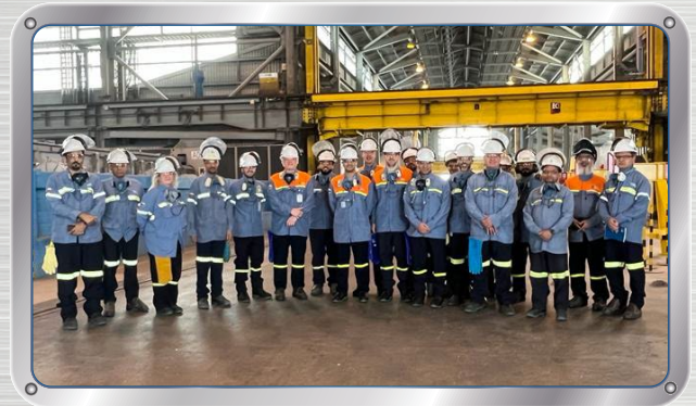
لجنة مراجعة الأعمال تجتمع وتزور المصنع BRC Meets and Tours the Plant