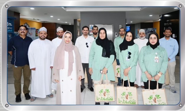
فريق المشتريات في فالي عمان يزور صحر أمنيوم Vale Procurement Team visits SA