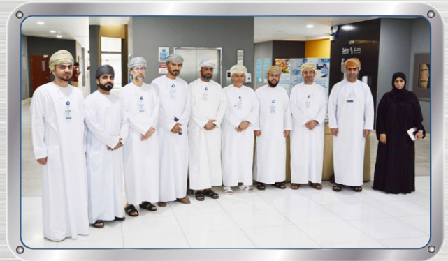
مدير عام مدينة صحر الصناعية يزور صحر أمنيوم Sohar Industrial City GM Visits SA