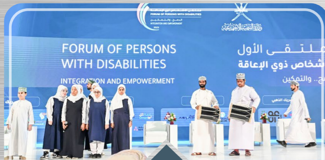
صحار أمنيوم ترعى الملتقى الأول للأشخاص ذوي الإعاقة SA Sponsors 1 st Forum of Persons with Disabilities