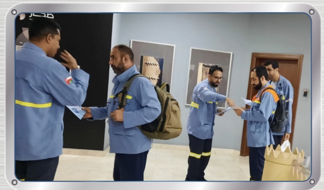
حملة التطعيم للوقاية من الانفلونزا Flu Prevention and Vaccination Campaign