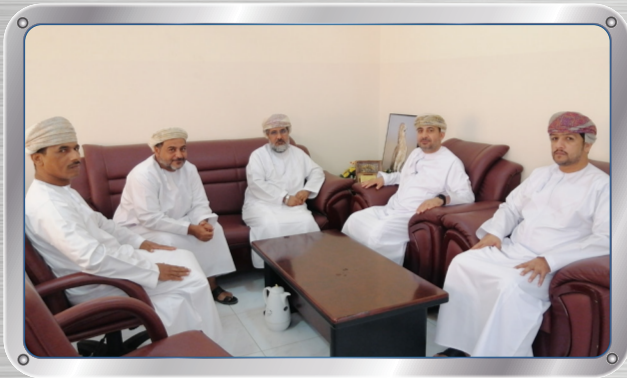
مدير عام الموارد البشرية وشؤون الشركة يزور إدارة البيئة بشمال الباطنة GM HR and Corporate Affairs Visits Directorate of Environment in North Al Batinah