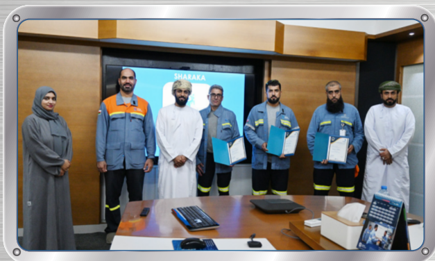
إقامة جلسة جديدة من برنامج شراكة New Sharaka Programme session held