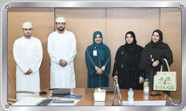
فريق الموارد البشرية في أوكيو يزور صحرار ألمنيوم OQ HR Team Visits SA