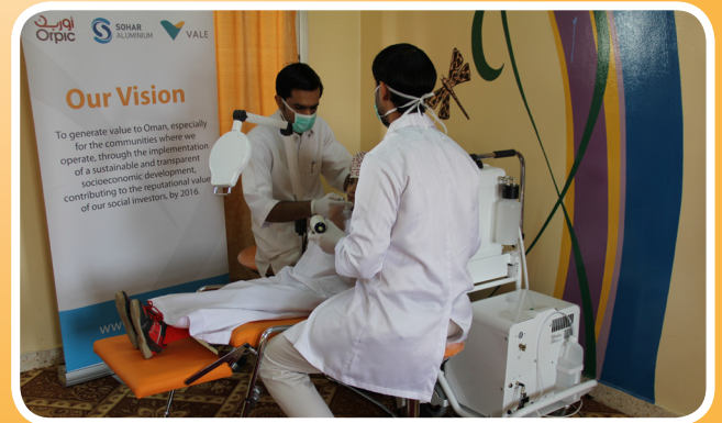
جسور تقدم كرسي طبي متنقل لفحص الأسنان في مدارس ولاية لوى Jusoor Provides a Mobile Dental Chair for Schools in Liwa

يسعدنا تلقي ارائكم وانطباعاتكم. في حالة كان لديكم أي تعليق أو تقرير أو رأي بشأن أي شئ متعلق بشركة صحار ألنيوم