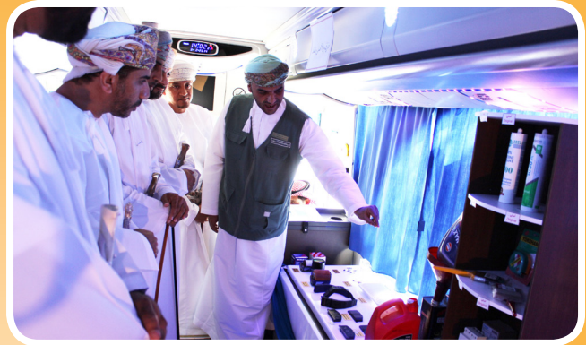
جسور ترعى أسبوع المستهلك الخليجي Jusoor Sponsors the GCC Consumers Week