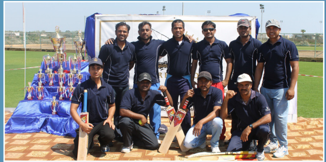
فريق صحار ألنيوم للكريكيت يشارك في مسابقة فندق شاطئ صحار SA Cricket Team Participates in SBH Tournament

We would like to hear from you. Should you wish to give feedback or report anything concerning Sohar Aluminium please contact us on hotline@sohar-aluminium.com / (+968) 26863317