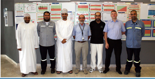
صحار ألنيوم تتبادل الخبرات مع شركة تنمية نفط عمان SA Shares Knowledge with PDO Team