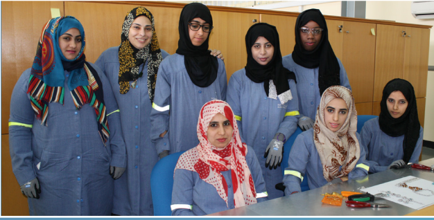
مشروع المشغولات الحرفية يؤتي أولى ثماره Craft Project Yields First Production