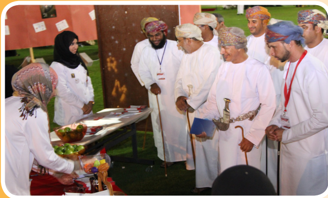
جسور ترعى الحملة التوعوية للحماية من أمراض القلب بكلية عمان الطبية Jusoor Sponsors the Cardiovascular Disorder Awareness Day in Oman Medical College