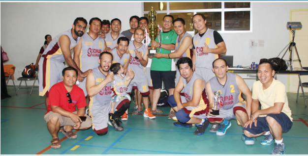
صحار ألنيوم وصيفاً لبطولة الجمعية الفلبينية لكرة السلة بصحار SA Basketball Team, 1st Runners-up in the PSAS Basketball Championship