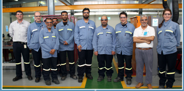
صحار ألنيوم تستقبل وفداً من جامعة السلطان قابوس Sohar Aluminium Hosts a Visit from Sultan Qaboos University