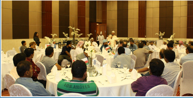
صحار ألنيوم تحتفي بالخاصين على ممتاز في الربع الأول لعام ٢٠١٤ م Sohar Aluminium Celebrates Mumtaz achievers in 2014, 1st Quarter