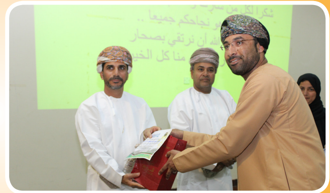
جسور تكرم ولايات صحار ولوى وشناص لفوزها في مسابقة برنامج "أصالة" التراثي 2014 Jusoor Awards the Winners in Asalah Contest from Sohar, Liwa and Shinas