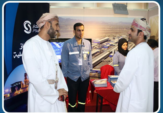
صحار ألمنيوم تلهم زوار معرض الوظائف بكلية العلوم التطبيقية بصحار