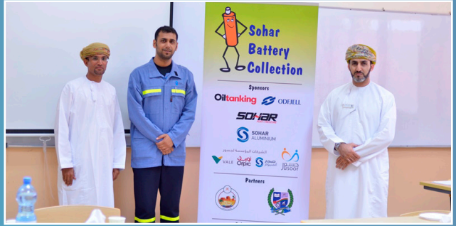
في اليوم العالمي للبيئة، صحار ألنيوم ترعى ورشة حول جمع البطاريات On World Environment Day, SA Sponsors Battery Collection Workshop