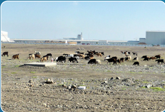
الأغنام ترعى بالقرب من صحار ألنيوم