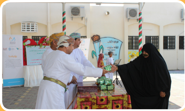
جسور ترعى مشروع القرية المتعلمة بولاية الخابورة Jusoor Sponsors the Educative Village in Al Khaboora

Jusoor a United CSR Vision for Sohar Aluminium, Orpic & Vale