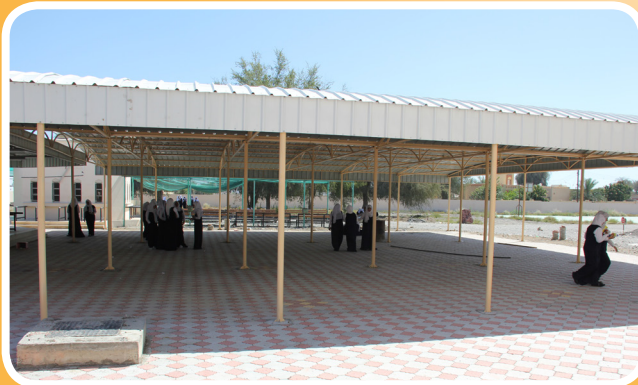
جسور تنشئ مضلة لمدسة حواء بنت يزيد بولاية صحار Jusoor Provides a Sun Shade at Hawwa bint Yazeed School