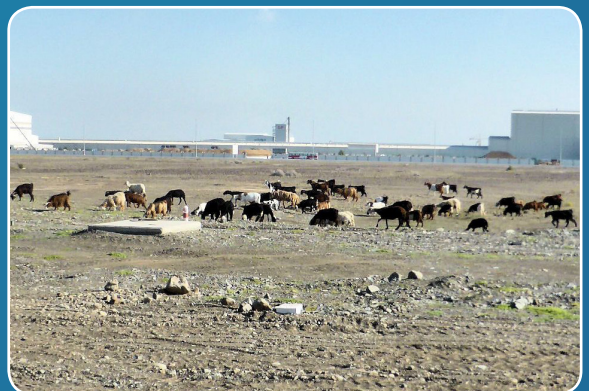
Goats grazing near Sohar Aluminium