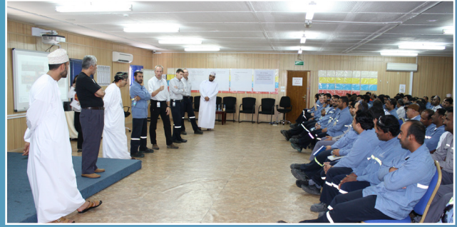
الفريق التنفيذي لصحار ألنيوم يلتقي بالموظفين لعرض حالة المصهر الحالية SA ExCo Presents the State of the Plant