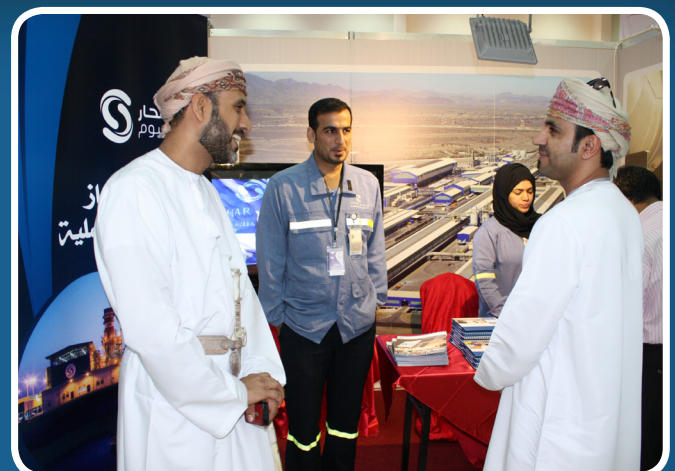
Sohar Aluminium's HR Team at College of Applied Sciences Career Fair