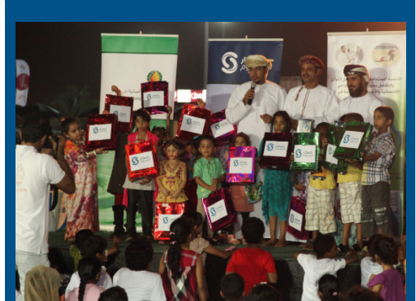
SA participates in Khareef Salah Annual Festival