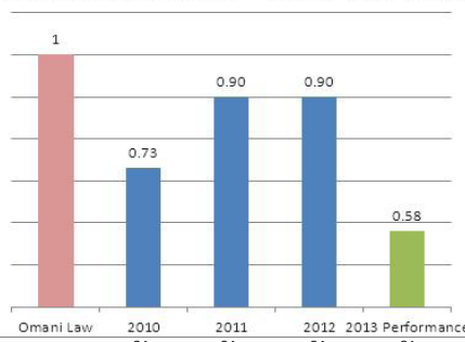
Fluoride emissions rate - Yearly (kg Ft/t Al)

وبالإضافة إلى العمل على خفض الإنبعاثات الصادرة من عمليات الشركة فقد حققت الشركة أيضاً إنجازات فيما يتعلق بإعادة تدوير الخلفات الناتجة من عملية التصنيع حيث تستطيع صحار ألنيوم الآن القيام بإعادة تدوير مخلفات برادة المعدن المسبوك إضافة إلى منتجات المعدن المسبوك الأخرى والطوب. يتم إعادة استخدام هذه المواد لصناعة مواد قابلة للإستخدام مرة أخرى. تواصل صحار ألنيوم تركيزها على ضمان إعادة تدوير أكبر كمية من الخلفات قدر الإمكان.