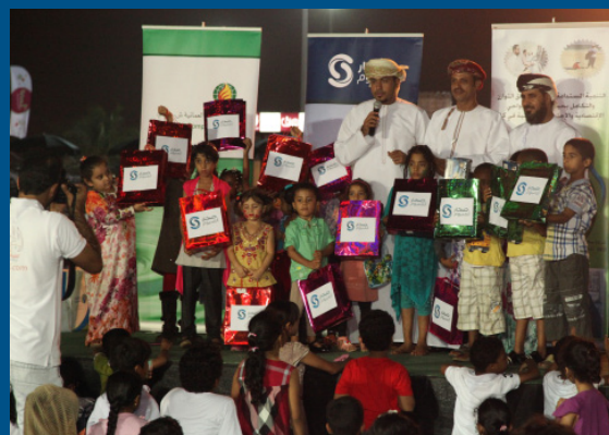
مشاركة صحار ألمنيوم في مهرجان خريف صالة السنوي