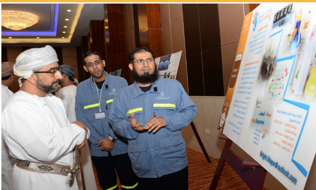
الحفل الختامي لبرنامج جسور للعمل التطوعي Closing Ceremony of Jusoor Volunteerism Program