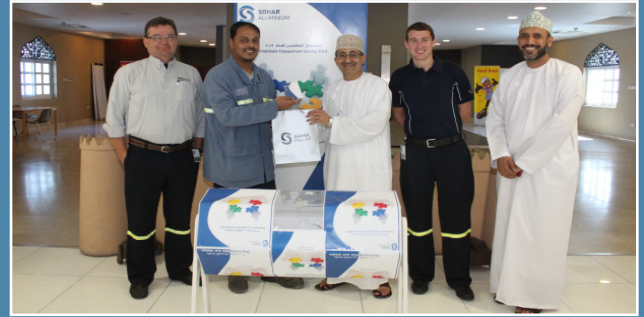
استبيان الموظفين لعام ٢٠١٣م Employee Engagement Survey 2013