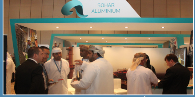
صحار ألنيوم تشارك في مؤتمر عربال ٢٠١٣م SA participates in Arabal Conference 2013