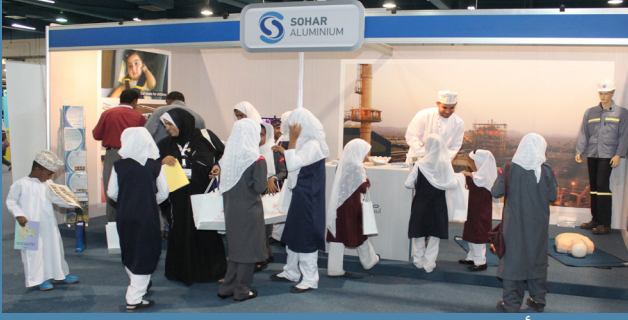
صحار ألنيوم تشارك في معرض السلامة المرورية ٢٠١٣م SA participates in ROP Traffic Safety Expo 2013