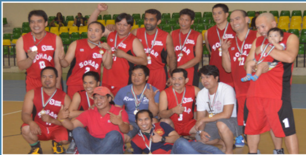
صحار ألنيوم تفوز بدوري كرة السلة في السيب SA wins Seeb Basketball League Championship