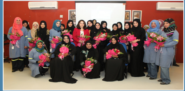
صحار ألنيوم تحتفل بيوم المرأة العمانية Sohar Aluminium celebrates Omani Women's Day