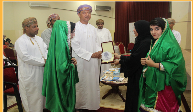
جسور تدعم جمعية المرأة العمانية بولاية صحار Jusoor Supports the Omani Woman Association in Sohar