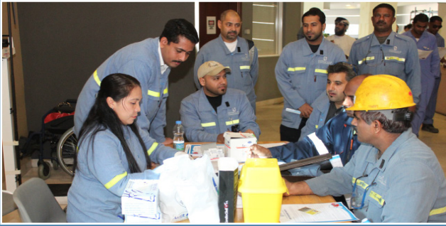
صحار ألنيوم تحتفل بيوم القلب العالمي SA celebrates World Heart Day