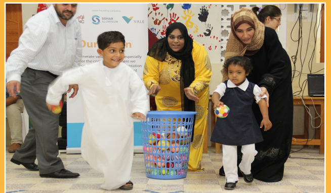
جسور تنظم يوم مفتوح للأطفال المعاقين بمناسبة عيد الأضحى المبارك In Celebration of Eid al-Adha, Jusoor Holds Open Day for Disabled Children

يسعدنا تلقي ارائكم وانطباعاتكم. في حالة كان لديكم أي تعليق أو تقرير أو رأي بشأن أي شئ متعلق بشركة صحار ألنيوم