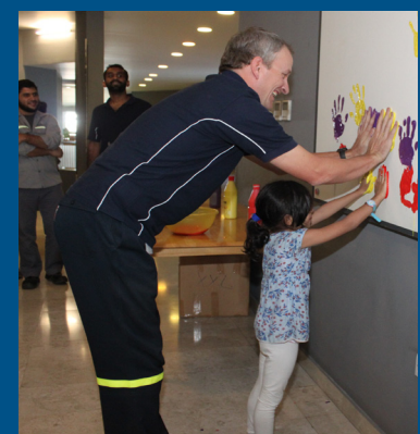
حملة سلامة اليدين والأصابع