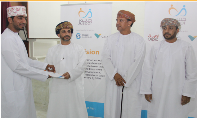
جسور تدعم الفرق الرياضية بنوادي صحار و مجييس و السلام Jusoor Supports the Sports Teams in Sohar, Majees and Al Salam Clubs

مذ اللحظة الأولى التي تم فيها التفكير في إنشاء مؤسسة جسور و التي تعني بإقامة مشاريع إجتماعية مستدامة في المجتمع المحلي . قامت الشركات المؤسسة لها ( صحار ألنيوم و أوريك و فالي ) بالتأكيد على مبدأ المسؤولية الإجتماعية كركيزة أساسية لهذه المؤسسة. وقد تكللت هذه الجهود بالنجاح فور إعلان هذه الشركات الثلاث عن تشكيل «جسور» كمؤسسة غير ربحية للمسؤولية الإجتماعية حيث تمت صياغة رؤيتها في تحقيق قيمة مضافة لعمان من خلال تنفيذ برامج تنمية إجتماعية وإقتصادية مستدامة تتسم بالشفافية وتساهم في تعزيز سمعة الشركات المستثمرة في عملها الإجتماعي. عمدت جسور الى ترجمة هذه الرؤية إلى واقع ملموس من خلال إقامة عدة مشاريع إجتماعية تهدف إلى المساهمة في عجلة التنمية الإجتماعية والإقتصادية إلى الأمام . إضافة إلى برامج الرعاية والتبرعات المواكبة لهذه المشاريع.