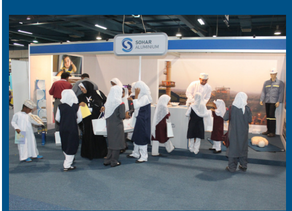
SA participates in ROP Traffic Safety Expo 2013