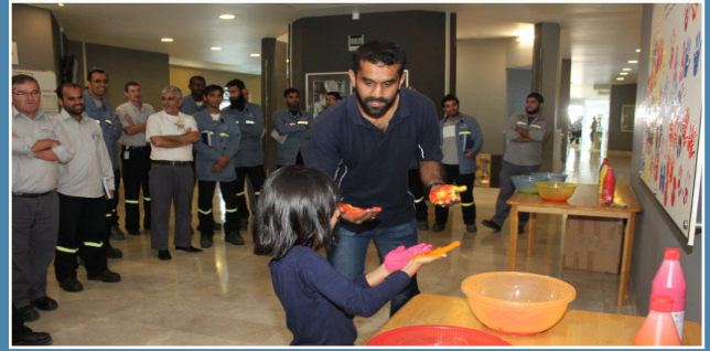
إنطلاق حملة صحار ألنيوم لسلامة اليدين والأصابع SA launches Hands and Fingers Campaign