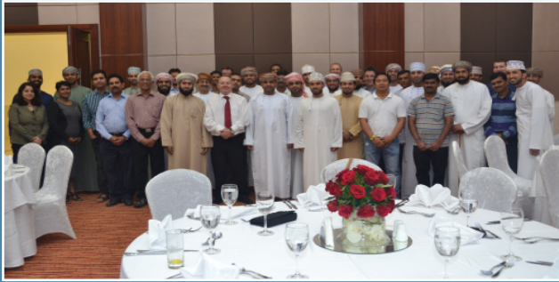
صحار ألنيوم تحتفل بالموظفين الأكفاء تحت برنامج ممتاز SA recognises employees achievements under Mumtaz Scheme