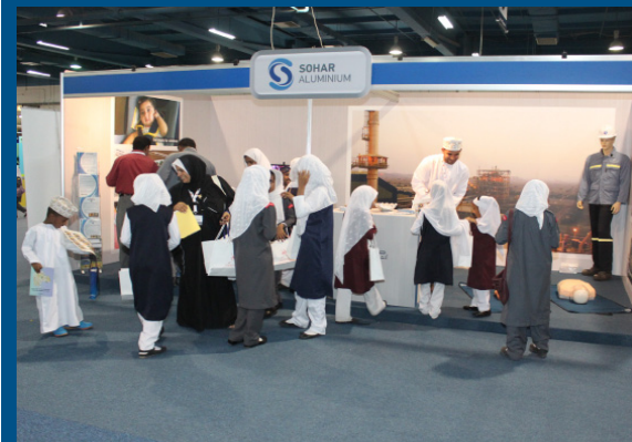
صحار ألمنيوم تشارك في معرض السلامة المروية ٢٠١٣م