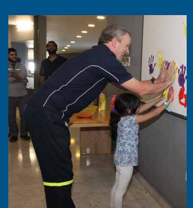
Hands and Fingers Campaign