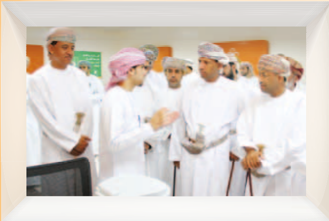
تدشين مختبر الروبوت التعليمي بالمديرية العامة للتربية والتعليم بشمال الباطنة Inauguration of Educational Robot Lab in DG of Education in North Al Batinah