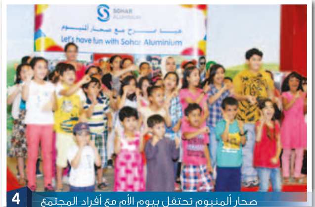
4 صحر أألومنيوم تحتفل بيوم الأم مع أفراد المجتمع Sohar Aluminium celebrates Mother's Day with Community

صحر أألومنيوم تحتفل مع أفراد المجتمع بالمقدم الميمون لصاحب الجلالة السلطان قابوس في السفير مول