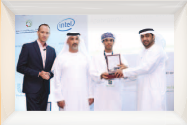
جسور تحصد جائزة أفضل مشروع لدعم وتمكين المرأة على مستوى الشرق الأوسط عن مشغل نرجس للخياطة الصناعية Jusoor Wins Best Project to Support and Empowering Women in the Middle East (Industrial Workshop, Narjis)