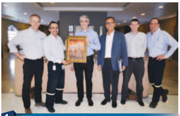
1 وفد رسمي من شركة ريو تينتو ألكان يزور صحر أألومنيوم Rio Tinto Alcan Officials visit Sohar Aluminium