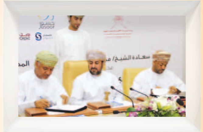
جسور والمديرية العامة للبلديات الإقليمية بشمال الباطنة توقعان إتفاقية تطوير حديقة فرح وصيانة فلجي القبائل والصباح Jusoor signed MoU to Restoration Fizih Park & Maintenance of Falaj Al Sibakh and Falaj Al Qabail