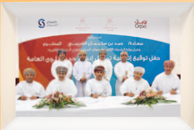
صحر أمنيوم وأوريك توقعان إتفاقية تمويل مشروع إنشاء حديقة الفلج العامة Sohar Aluminium & Orpic Signed MoU to Finance Falaj Park