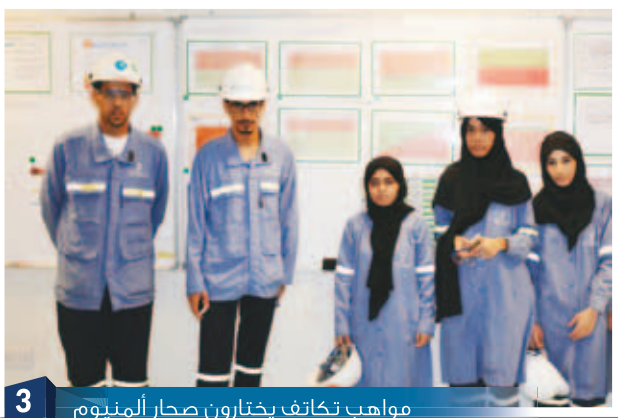
3 مواهب تكاتف يختارون صحر أألومنيوم Mawahib Takatuf choose Sohar Aluminium