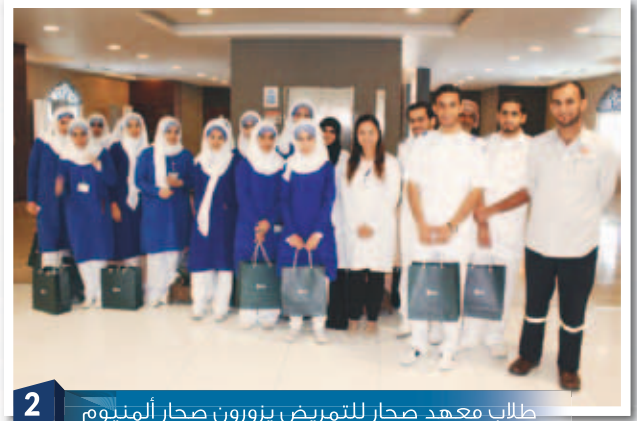
2 طلاب معهد صحر للتريض يزورون صحر أألومنيوم Nursing Students visit Sohar Aluminium