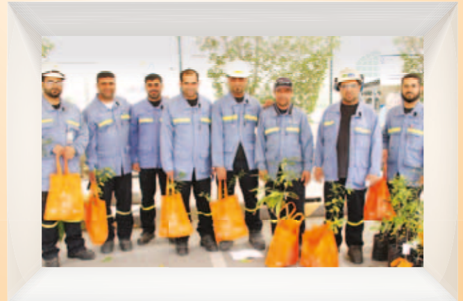
تنفيذ حملة "إزرع شجرة" ضمن برنامج جسور للعمل التطوعي "Plant a tree" Campaign as an Activity of Jusoor Volunteering Program 2015