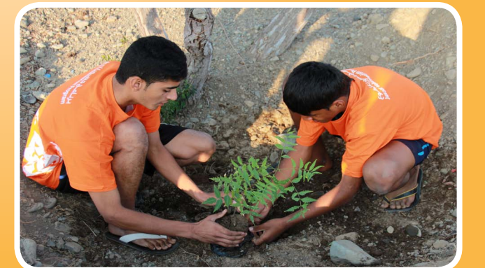
جسور تنظم حملة أزرع شجرة الثالثة في ولاية لوى Jusoor organized the "3rd Plant a Tree in Liwa

يسعدنا تلقي ارائكم وانطباعاتكم. في حالة كان لديكم أي تعليق أو تقرير أو رأي بشأن أي شئ متعلق بشركة صحار ألنيوم