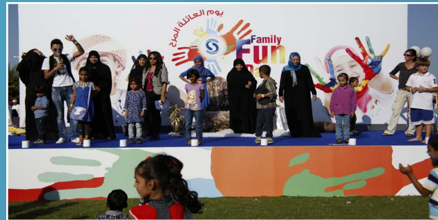
نظمت صحار ألنيوم يوم العائلة المرح Sohar Aluminium conducts Family Fun Day