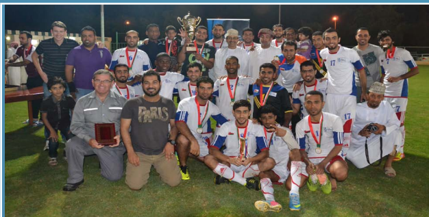
صحار ألنيوم تفوز في بطولة شركة مجان للكهرباء لكرة القدم SA wins Majan Electricity football tournament