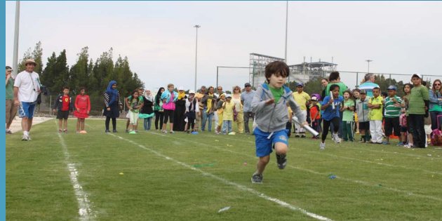
نظمت مدرسة الباطنة العالية - إحدى أنشطة صحار ألنيوم- اليوم الرياضي السنوي ABIS hosts « Annual Sports Day » at Sohar Aluminium