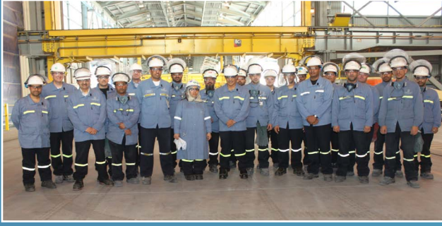
استقبلت شركة صحار ألنيوم وزير النفط والغاز في زيارته لصهر Minister of Oil & Gas visits Sohar Aluminium