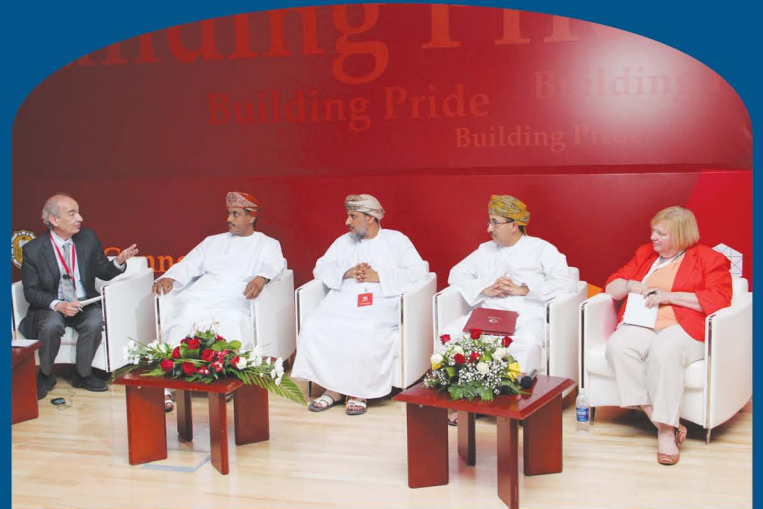
الرئيس التنفيذي لصحار ألمنيوم يشارك في مناقشات منتدى تكاتف