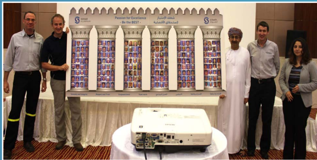
تدشين اللوحة التذكارية للحاصلين على ممتاز لعام ٢٠١٣ م Sohar Aluminium celebrates Excellent achievers in 2013