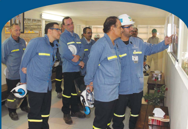
زيارة وزير النفط والغاز لمصهر صحار ألمنيوم