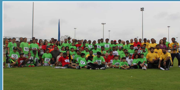
نظمت صحار ألنيوم يوم السباق المرح ٢٠١٤م للموظفين وعائلاتهم Sohar Aluminium conducts Fun Run 2014

We would like to hear from you. Should you wish to give feedback or report anything concerning Sohar Aluminium Please contact us on hotline@sohar-aluminium.com / +96826863317