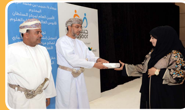
جسور ترعى ١٤٢ متدرب ومتدربة في المجالات الإدارية والمالية بمحافظة شمال وجنوب الباطنة Jusoor Sponsors 142 Trainees in Administrative & Financial Training Programs in cooperation in North and South Al Batinah.