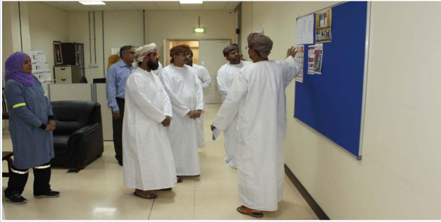
فريق صحار ألنيوم يقوم بزيارة لمركز التدريب بمستشفى صحار SA team visits Sohar Hospital's Training Centre