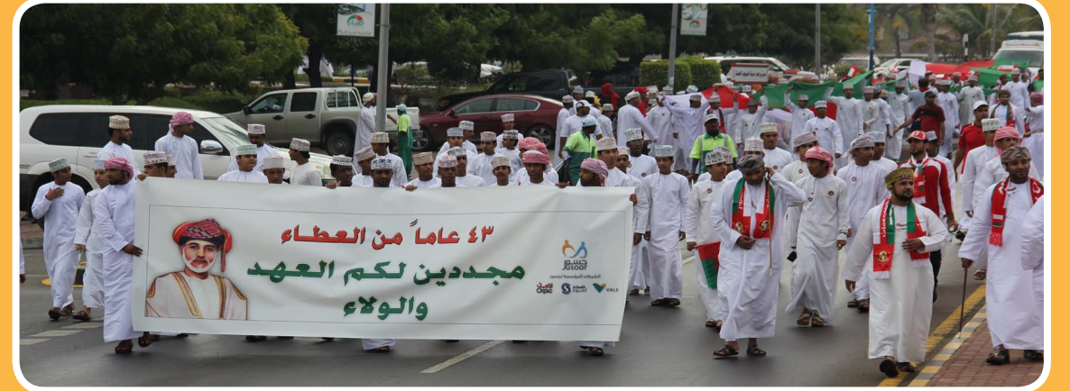
شاركت مؤسسة جسور في مسيرة الولاء والعرفان التي تم تنظيمها في ولاية صحار بمناسبة العيد الوطني الثالث والأربعين الجيد. Jusoor team joined the mass the Wilayat of Sohar in a march of loyalty and gratitude to H.M. the Sultan of Qaboos bin Said on the occasion 43 rd National Day.