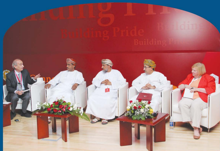
Sohar Aluminium CEO presents at 'Takatuf' Forum