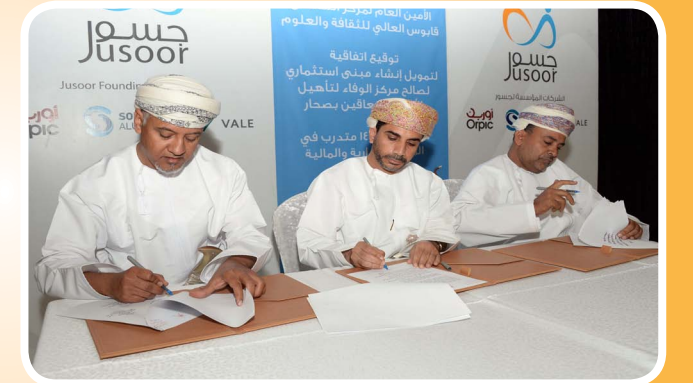
جسور ووزارة التنمية الإجتماعية و لجنة التنمية الإجتماعية بصحار يوقعون إتفاقية إنشاء مبنى إستثماري لمركز الوفاء لتأهيل الأطفال المعاقين بصحار Jusoor, MOSD and SDC in Sohar sign an Agreement for investing a Building for Al Wafa Center for Handicapped Children in Sohar.