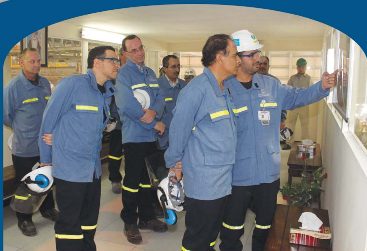
Minister of Oil and Gas Visits Sohar Aluminium