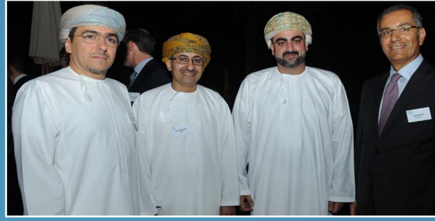
صحار ألنيوم تفتخر بإستضافة حفل عشاء المؤتمر الخليجي للألنيوم SA proudly hosts Gulf Aluminium Dinner