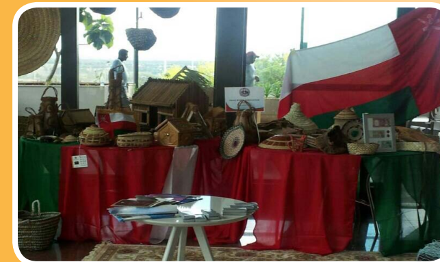
جسور ترعى إحتفال جمعية المرأة بصحار بالعيد الوطني بالبرازيل Jusoor sponsors Omani Women Association in the national day celebration in Brazil