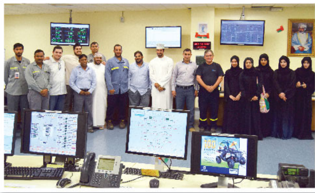
طالبة من جامعة صحر يزورون محطة الطاقة في صحر أمنيوم SA Power Plant Receives Students from Sohar University