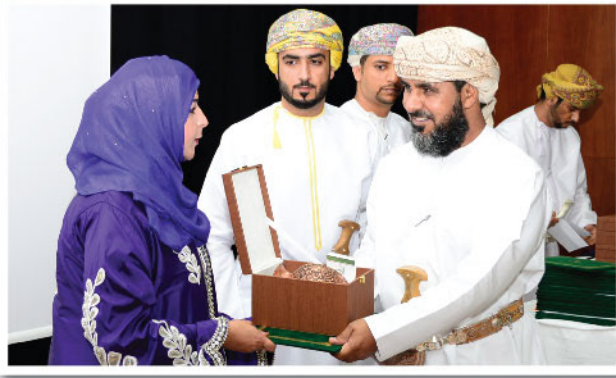
تكریم صحر أمنيوم في إحتفال يوم الحرفي العماني SA Recognized at the Omani Craftsman Day Celebration