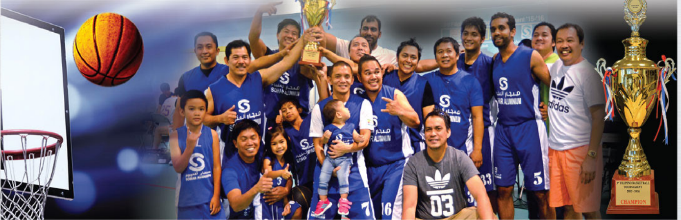
فريق صحر أمنيوم لكرة السلة يتوج بطلاً للبطولة الثالثة للجمعية الاجتماعية الفلبينية في الباطنة