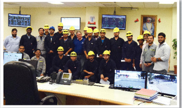
طالبة من الكلية التقنية بشنص يزورون محطة الطاقة في صحر أمنيوم SA Power Plant Receives Students from Shinas College of Technology