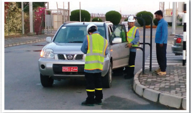
دائرة الهندسة تنظم حملة توعوية حول السلامة المرورية في صحر أمنيوم Engineering Department Conducts Traffic Safety Awareness Campaign in SA