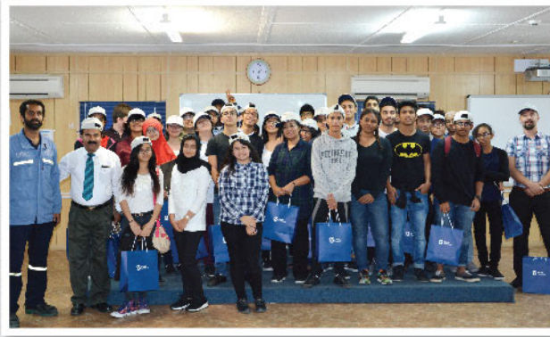
طلاب مدرسة مسقط العالمية يزورون مصهر صحر أمنيوم Students from Muscat International School visit SA facilities