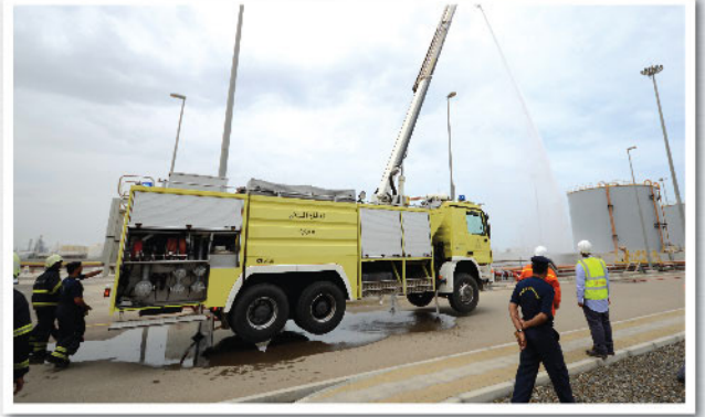
تنفيذ تمرين للطوارئ و إخماد الحريق في محطة الطاقة بصحر أمنيوم Fire and Emergency Drill in SA's Power Plant Conducted