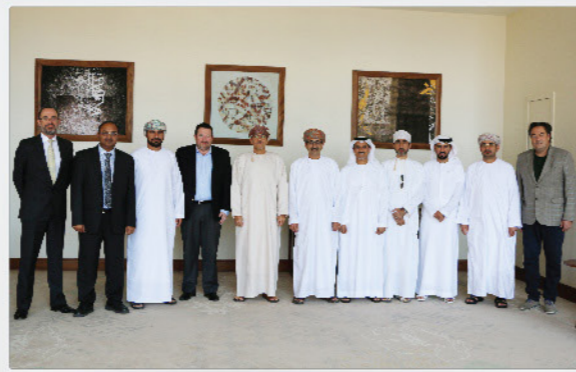
اجتماع مجلس الإدارة Sohar Aluminium Board Meeting Held