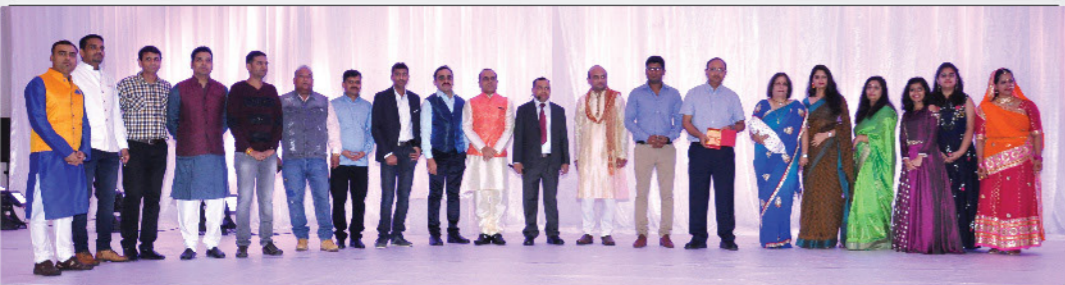
حفلة ديوالي في صحار Diwali Party in Sohar