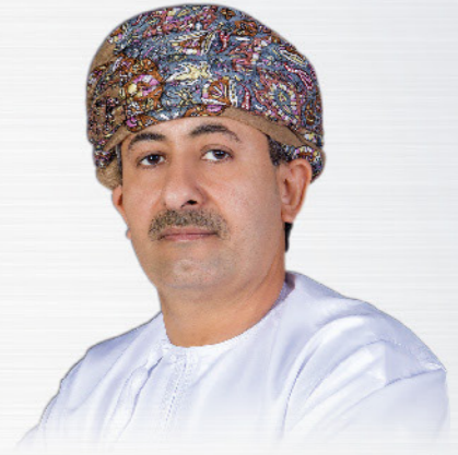
أعزائي القراء ،

مرحباً بكم في أحدث إصدار من نشرتنا لعام ٢٠١٩.