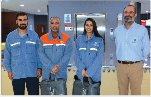
صحار ألنيوم تستضيف تنفيذيين من شركة النفط العمانية SA Hosts Executives from Oman Oil Company