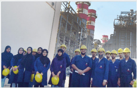
طلبة الكلية التقنية بشناس يزورون محطة الطاقة SCT Students Visit SA