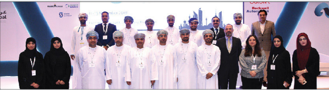
صحار ألنيوم تشارك في مؤتمر عربال ٢٠١٨ SA Participates in ARABAL 2018