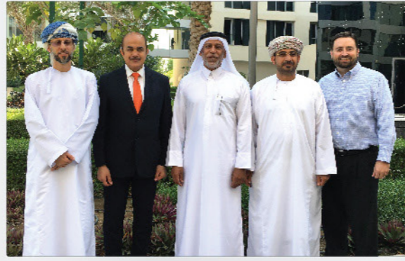
لجنة الموارد البشرية بالمجلس الخليجي للألنيوم تجتمع في عمان GAC HR Committee Meets in Oman