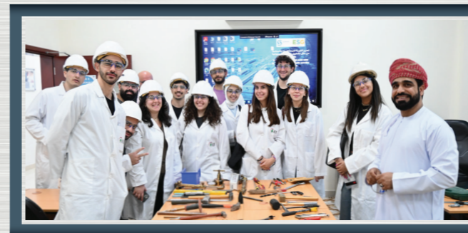
طلبة تخصص الهندسة الكيميائية من الجامعة الأمريكية في بيروت يتعرّفوا خلال زيارتهم على صناعة الألمنيوم

HR Team explores cooperation opportunities with Sohar University and Al Buraimi University College