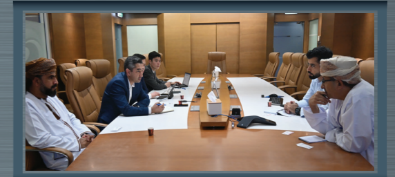
الرئيس التنفيذي لصحر أمنيوم يبحث أوجه التعاون وفرص الاستثمار مع وفد شركة أكفا للألمنيوم بأوزبكستان

A group of Chemical Engineering students from Sohar University receive first-hand experience on the company's standards & process of wastewater management