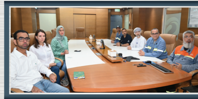
زيارة وفد شركة فالي في عُمان والبرازيل لمعهد صحر للتدريب الصناعي ومرافق المصهر المختلفة

A delegation from Vale Oman & Brazil visits Sohar Industrial Training Institute & toured the smelter's facilities