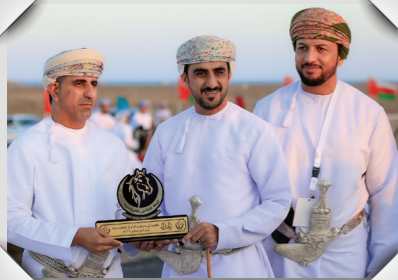
مهرجان عرضة الخيل التقليدية Traditional Horse Show Festival