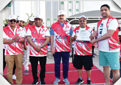
فعالية المشي من أجل الحياة بصحار Walk For Life Event