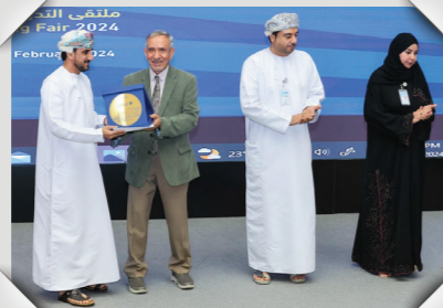
ملتقى التدريب ٢٠٢٤ بجامعة صحار Training Fair 2024, Sohar University