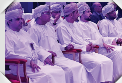
حفل يوم الصناعة العماني Omani Industry Day Celebration

مؤسسة جسور ذراع الاستثمار الاجتماعي لشركات صحار ألمنيوم، وفالي عمان، وأوكيو Jusoor Foundation is the social investment arm of Sohar Aluminium, Vale Oman and OQ