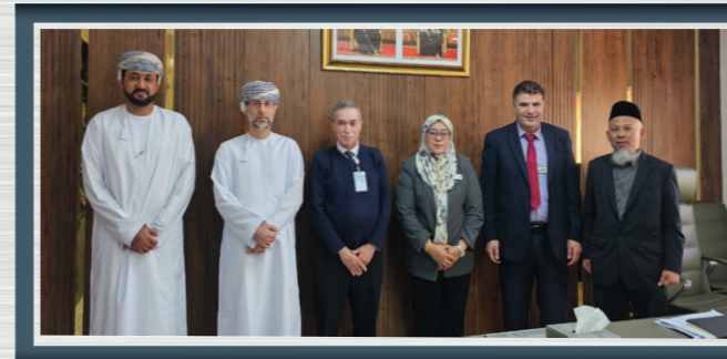
فريق الموارد البشرية يبحث أوجه التعاون مع جامعة صحر وكلية البريمي الجامعية

A delegation from Vale Oman & Brazil visits Sohar Industrial Training Institute & toured the smelter's facilities