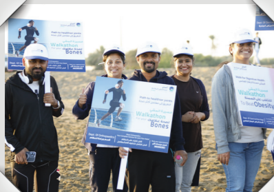
فعالية مسير صحار الثالث Sohar Walk 3 Event