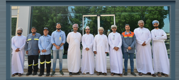
استضافت صحر أمنيوم اجتماع مجلس إدارة جمعية الصناعيين العمانية، واطلع المجلس على مختلف مرافق المصهر ومعهد صحر للتدريب الصناعي

A delegation from the eleventh course of the National Defense College gets familiarised with the company's business and its different facilities