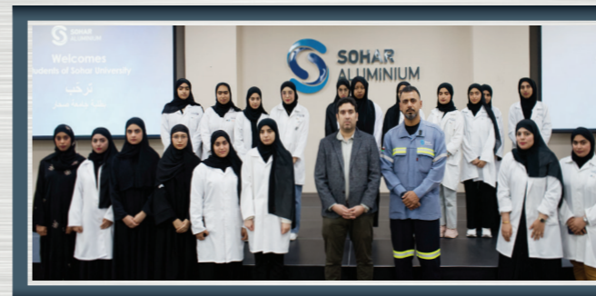
زيارة طلبة الهندسة الكيميائية من جامعة صحر للتعرف على المعايير والإجراءات التي تتبعها الشركة في عملية إدارة ومعالجة المياه

Chemical Engineering students from the American University of Beirut are briefed on Aluminium process