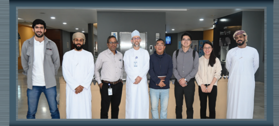
وفدًا من إحدى الشركات الاستثمارية الصينية بالمنطقة الحرة بصحر يطلع على تجربة الشركة في إدارة الموارد البشرية

Sohar Aluminium's CEO discusses investment opportunities with a delegation from Akfa Aluminium company, Uzbekistan