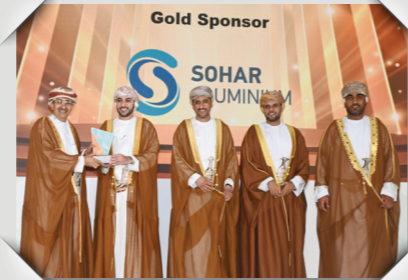
منتدى صحار للاستثمار ٢٠٢٤ Sohar Investment Forum 2024