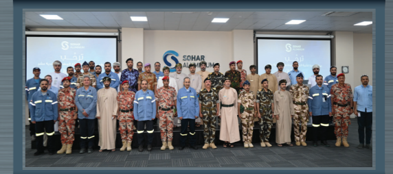
وفد دورة كلية الدفاع الوطني الحادية عشر برئاسة اللواء الركن بحري علي بن عبدالله الشيدي، أمر كلية الدفاع الوطني، يتعرّف على أبرز أعمال الشركة ومرافقها المختلفة

A delegation from "United Solar Polysilicon" visits Sohar Aluminium to understand the company's experience in HR management