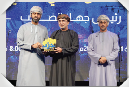
فعالية جرب جنوب الباطنة ٢٠٢٥ Experience South Al Batinah Event 2025