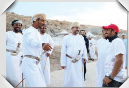
مخيم النحاتين ٢٠٢٥ Sculptors Camp 2025