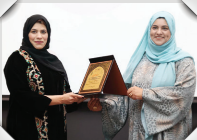
مؤتمر التدريب على الموجات فوق الصوتية في مجال أمراض النساء والولادة Conference on Ultrasound Training in Obstetrics and Gynaecology