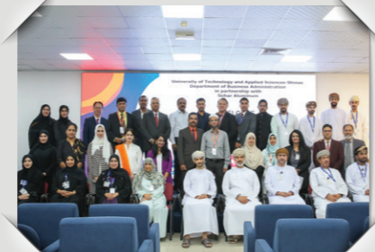
مؤتمر كونفلونس ٢٠٢٥ Confluence 2025

مؤسسة جسور ذراع الاستثمار الاجتماعي لشركات صحر ألألومنيوم، وفالي عمان، وأوكيو Jusoor Foundation is the social investment arm of Sohar Aluminium, Vale Oman and OQ