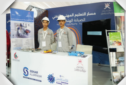
معرض التخصصات الجامعية والبرامج التدريبية University Specializations and Training Programs Exhibition