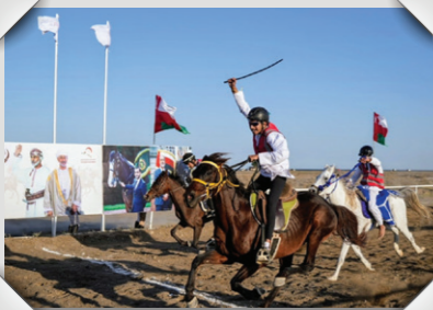
مهرجان شنافس للفروسية Shinas Equestrian Festival